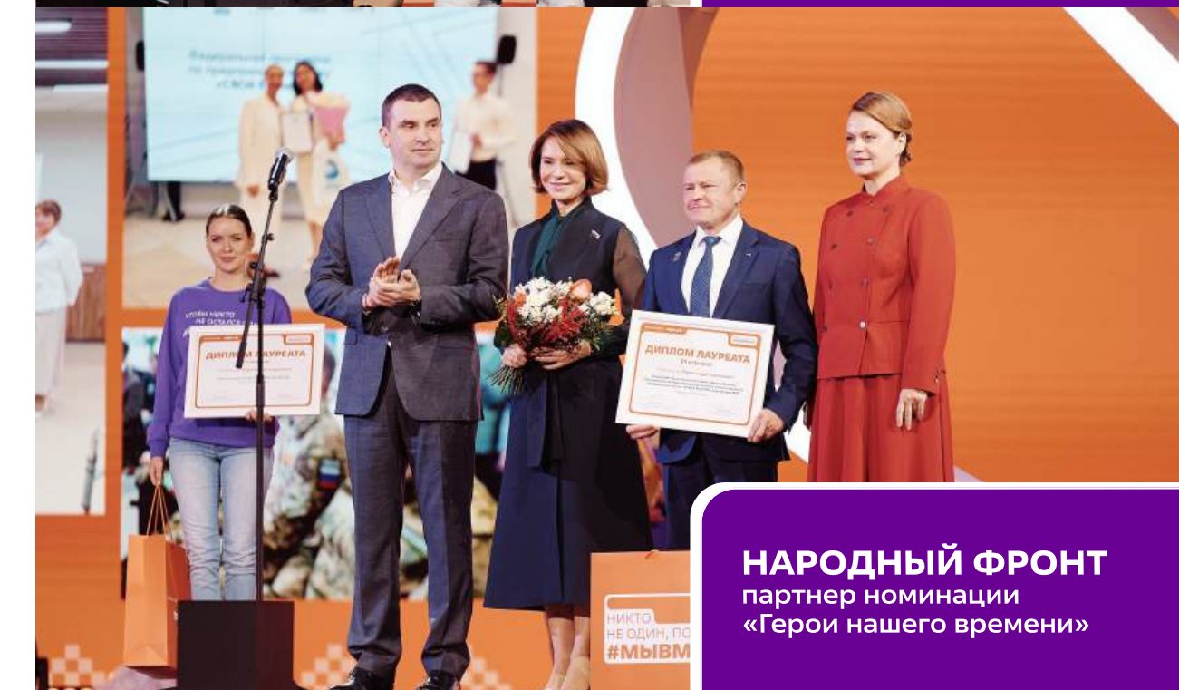
НАРОДНЫЙ ФРОНТ партнер номинации «Герои нашего времени»