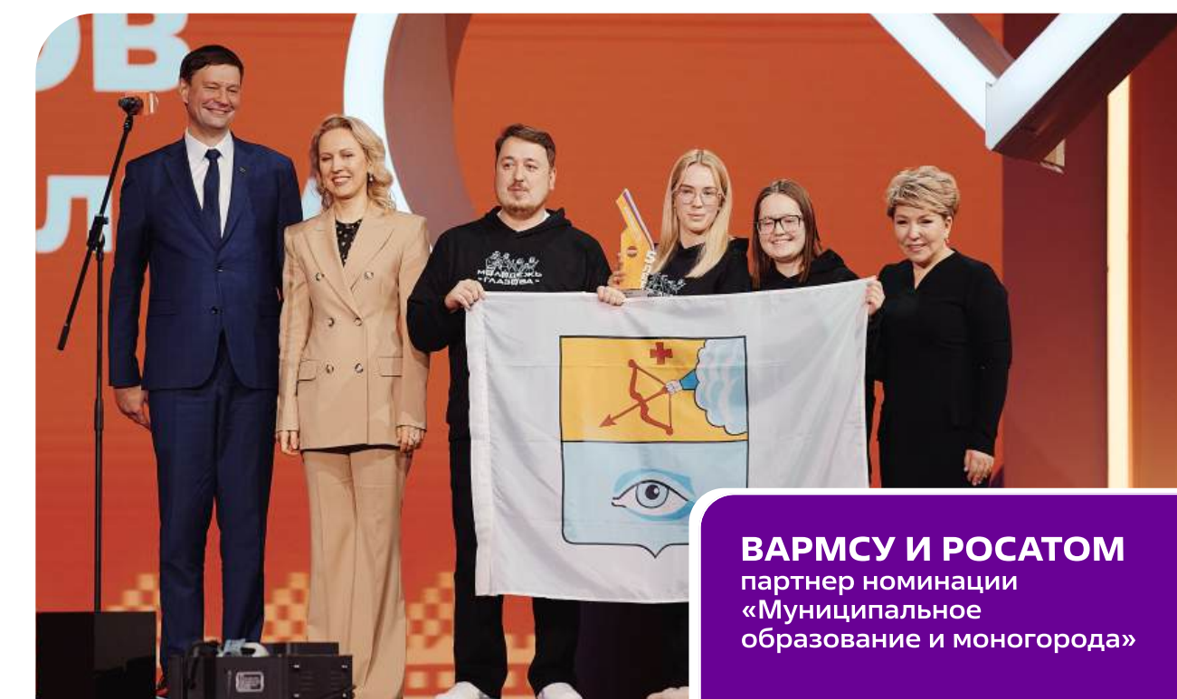
ВАРМСУ И РОСАТОМ партнер номинации «Муниципальное образование и моногорода»