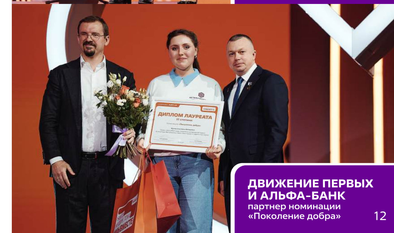
ДВИЖЕНИЕ ПЕРВЫХ И АЛЬФА-БАНК партнер номинации «Поколение добра»